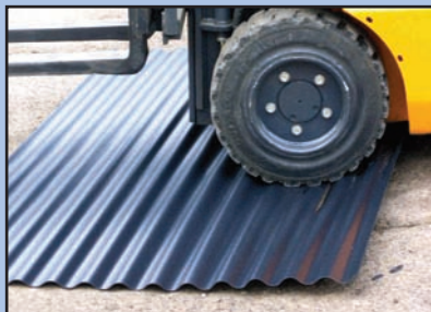
SALUX WBS übersteht sogar den Staplertest!